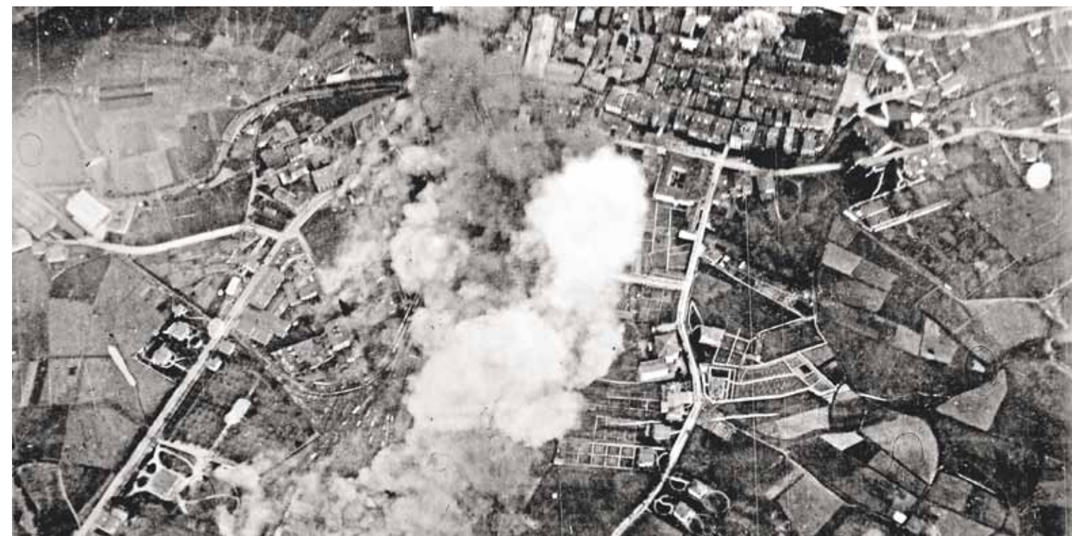
Durangoko bonbardaketaren irudia, airetik aterata.

229 etxe kaltetuak izan ziren. Durangon. Horietatik 70 osorik bota behar izan zituzten, eta bostetik zati batzuk. Garai hartan frankistek eurek egindako balorazioak dioenez, eraikinetan 4.239.901 pezetatakoak izan ziren kalteak. ‘Regiones devastadas’, Francoren departamentuak 1939an egin zuen balorazio bat izan zen.